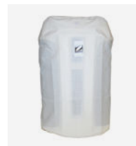
Funda de protección