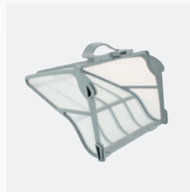
Filtro rectangular Filtro muy rígido de gran capacidad (5 litros)