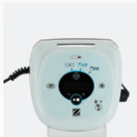
Unidad de control