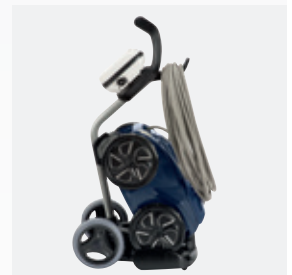
Carro de transporte