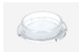
Tapón de invierno

Los cloradores salinos son una solución de desinfección automática y eficaz . Son fáciles de utilizar y se obtiene un tratamiento del agua completo y un mantenimiento reducido .