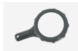
Llave apriete célula